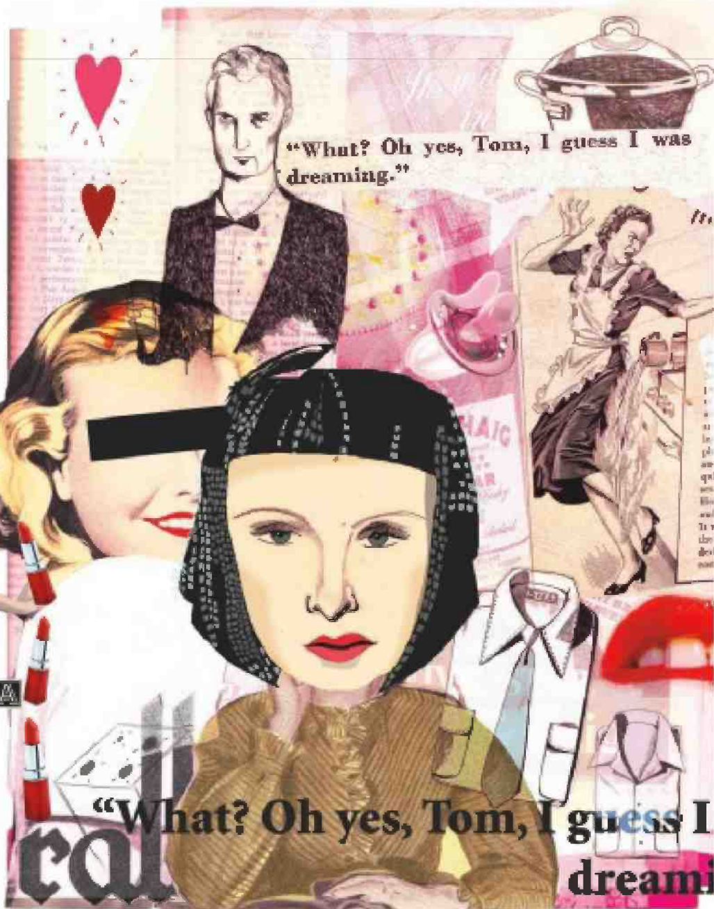
איור: אילה טל

המחקר מצא שנשים גם פחות מעוניינות להידרש לניהול משא ומתן בעבודה העתידית שלהן לעומת גברים. ניתן להסיק שהן גם פחות מתמקדות על שברן. פרנקל: "כן, מחקרים רבים מראים שנשים פחות מתמקחות על שכר, וזו אחת הסיבות לפערי השכר". שלא במפתיע, המחקר מצא שנשים נותנות מש"קל גרול יותר לפרמטרים כמו ביטחון תעסוקתי ושעות עבודה גמישות - בהשוואה לגברים. גם מחקר שערכה פרנקל על נשים בהייטק כבר לפני עשור העלה תוצאות דומות, וקושר בין בחירת משרה נוחה לבין אמהות. המחקר נערך אחרי שהתפורר צצה בועת ההייטק, ונשים אז ריווחו שהן מעוניינות במשרות המקנות ביטחון תעסוקתי. נוסף על כך, אמהות ייחסו חשיבות גדולה יותר לפרמטרים המאפשרים להן לשלב בין קריירה לאמהות, כמו קרבה לבית, שעות עבודה גמישות ועבודה מהבית -